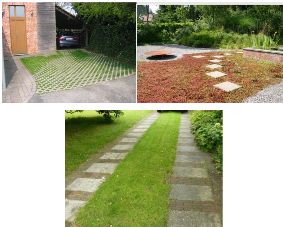
Voorbeelden van waterdoorlatende verharding

De kleur van de verharding speelt een belangrijke rol. Lichtgekleurde verharding zal het zonlicht beter reflecteren en bijgevolg minder opwarmen. Donkere materialen worden beter vermeden, meer zelfs, ze worden onbetreedbaar in de zomerzon en warmen de omgeving verder op.