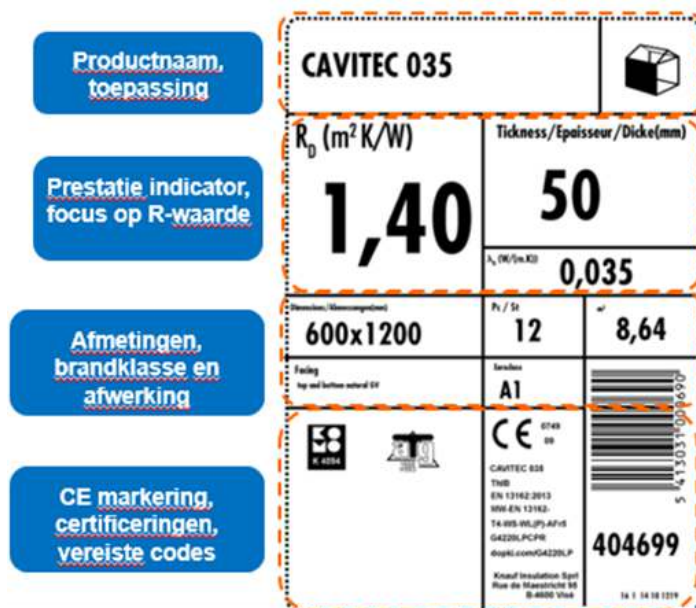
Etiket van een fabrieksmatig vervaardigd isolatiemateriaal

Afhankelijk van de toepassing is de keuze voor een materiaal met een goede brandreactieklasse meer of minder belangrijk. Bijvoorbeeld bij isolatie bovenop een massief plat dak of in een spouwmuur zal dit weinig belang hebben. Bij binnenisolatie daarentegen werk je materialen met een minder goede brandreactieklasse (vanaf klasse C) en/of materialen die zorgen voor rookontwikkeling en/of druppelvorming (vooral kunststofisolatie) aan de binnenzijde best af met een afwerking met een brandweerstand van minstens een half uur.