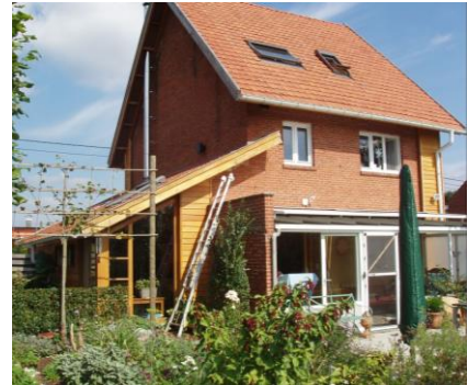
Voorzie een dakoversteek bij het vernieuwen van het dak