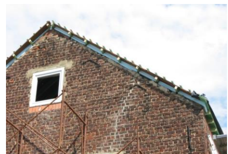
Koudebruggen wegwerken ter hoogte van de tipgevels (Foto: arch. D. Van Clé)