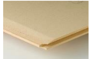
Onderdak in houtvezelplaten

Houtvezelonderdakplaten worden gemaakt van houtrestanten, waarbij het in het hout aanwezige hars als bindmiddel dient. Om de platen waterdicht te maken, worden ze behandeld met een mengsel van water en bitumen of met latex. De platen zijn capillair en dampdoorlatend ( S_d = 0,10 tot 0,25 m). Hun tand- en groefverbinding verzekert de goede winddichtheid ter hoogte van de aansluitingen tussen twee platen waardoor het afkleven beperkt kan blijven tot de verbindingen zonder tand- en groef (bv. ter hoogte van de nokken, dakdoorvoeren of dakvlakramen). De platen zijn daarenboven isolerend ( \lambda = 0.046 à 0.055 W/m 2 K), waardoor ze de koudebrugwerking ter hoogte van de kepers of sporen verminderen. Standaard hebben ze een dikte van 18 of 22 mm. In grotere diktes worden ze soms gebruikt als buitenste isolatielaag bij sarkingdaken uit houtvezelisolatieplaten.