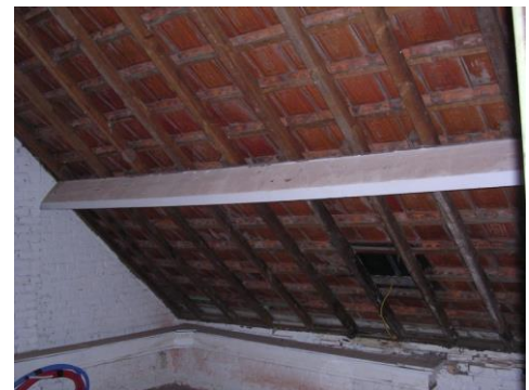
Bestaand hellend dak zonder onderdak

Bij nieuwe hellende daken wordt altijd een onderdak geplaatst. Bij bestaande daken is vaak geen onderdak aanwezig. Bij een aan de binnenzijde niet afgewerkt dak, is de aanwezigheid van een onderdak eenvoudig vast te stellen: kun je van op de zolder de dakpannen zien, dan heb je te maken met een dak zonder onderdak. Bij een dak dat wel aan de binnenzijde volledig is afgewerkt is dat vaak moeilijker. Enkel door het oplichten van enkele pannen of door het verwijderen van een deel van de binnenbekleding, kan je dit nagaan. Een geschikt onderdak in goede staat is een essentieel onderdeel van een dak. Isoleren van een hellend dak zonder of met een beschadigd of ongeschikt onderdak houdt risico's in.