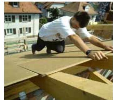
Houtvezelplaat met tand en groef

Bij houtvezelonderdakplaten kies je best voor tengellatten met een minimum hoogte van 2 cm. De platen moeten met de tand naar boven geplaatst worden om waterinfiltratie in de groef te vermijden. Ze zijn niet geschikt om langdurig blootgesteld te worden aan rechtstreekse weersinvloeden, de dakbedekking moet ten laatste na 6 weken geplaatst worden. Houtvezelonderdakplaten mogen niet verward worden met gewone houtvezelplaten. Er zijn ook wel onbehandelde houtvezelplaten op de markt bedoeld voor gebruik als onderdak, deze moeten echter altijd in combinatie met een dampopen onderdakfolie geplaatst worden. Houtvezelonderdakplaten zijn een goede keuze. Ze zijn in aankoop vaak duurder dan andere materialen, maar de correcte winddichte afwerking is dan weer minder werk dan bij folies en beter gegarandeerd. Ze laten ook toe om het dak te isoleren met vlokken.