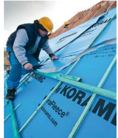
Onderdakfolie met geïntegreerde kleefstrook

De stroken onderdakfolies worden met een overlapping geplaatst. Enkel wanneer de overlappingsen afgekleefd worden, vooraleer de tengellatten geplaatst worden, kan een winddichte uitvoering gerealiseerd worden. Sommige onderdakfolies zijn beschikbaar met een geïntegreerde kleefstrook, wat het winddicht maken sterk vereenvoudigt.