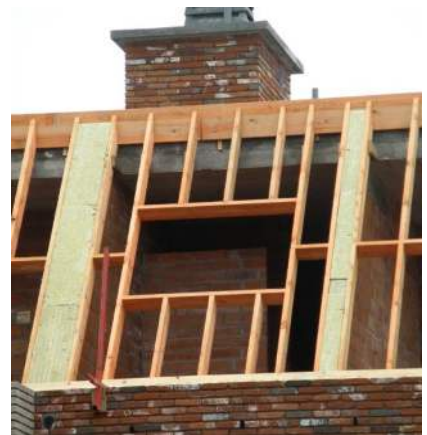
Stroken isolatie tussen onderdak en metselwerk