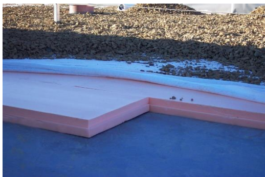
Omkeerdak met scheidingslaag tussen de isolatie en de ballast

Ook aan de randen moet vaak bijkomende ballast voorzien worden, omdat de windlasten hier hoger zijn.