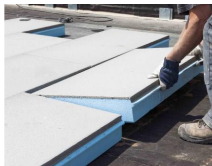
XPS-platen met cementering, foto Styrofoam