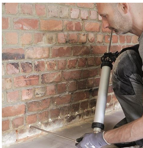
Vochtproblemen oplossen vooraleer de muren te isoleren: injecteren tegen opstijgend vocht

Nieuwe vochtproblemen vermijd je door een juiste muuropbouw. Elke geïsoleerde constructie moet bouwfysisch correct uitgevoerd worden , niet alleen om warmteverliezen tegen te gaan maar ook om condensatie en schimmelvorming te vermijden.