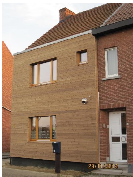
Met buitenisolatie kan je het uitzicht van je woning volledig veranderen

Eerst al het buitenschrijnwerk vervangen en pas later alle muren isoleren, is dan weer niet ideaal. Beter is om gevel per gevel in zijn geheel aan te pakken: schrijnwerk vervangen én de muur isoleren. Zo stem je beide op mekaar af en vermijd je koudebruggen. Isoleer dus gerust dit jaar de achtergevel van je rijwoning en binnen vijf jaar de voorgevel. Of omgekeerd.