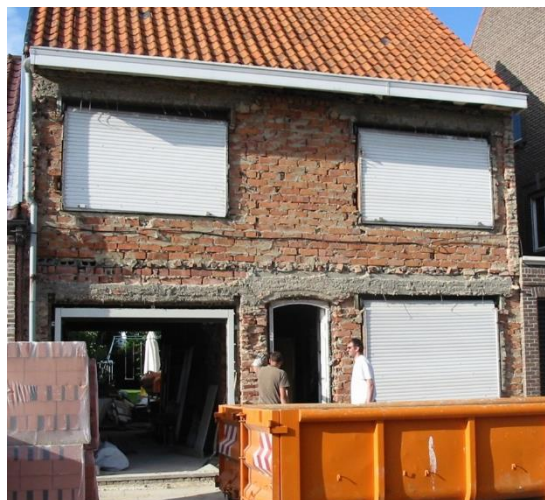
Verwijderen van de gevelsteen: de achterliggende draagmuur is zelden vlak

Voor nieuwe muren vind je info over akoestisch en thermisch isolerende binnenspouwbladen in de fiche over nieuwe spouwmuren .