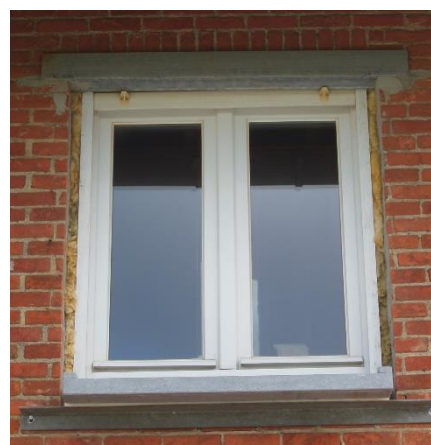
Koudebruggen tussen gevelisolatie en schrijnwerk wegwerken door afslijpen van het metselwerk boven en naast het raam en nieuwe dorpel