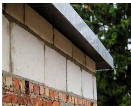
Dakrandaanpassing met isolerende bouwblokken en een dakoversteek

Bij gevels palend aan vloeren boven een (kruip)kelder kan dit eveneens toegepast worden, maar zal bijkomend een strook (kruip)kelderplafondisolatie tegen de bovenzijde van de muren geplaatst moeten worden.