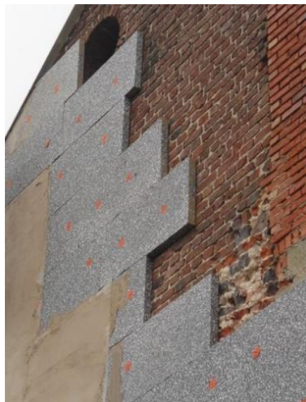
Bestaande volle muur isoleren door buitenisolatie

In deze fiche bespreken we de isolatie van massieve buitenmuren door buitenisolatie of 'gevelisolatie' . Hierbij leggen we de klemtoon op het na-isoleren van bestaande muren , maar de algemene principes zijn ook van toepassing op buitenisolatie bij nieuwe volle, massieve muren.