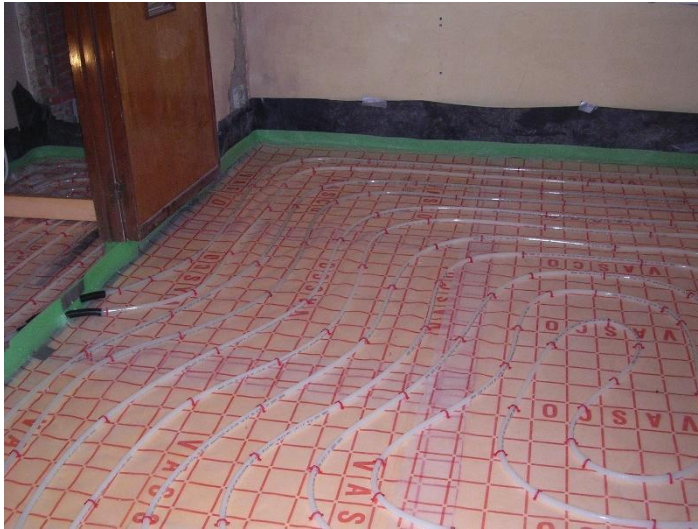
Een nieuwe of vernieuwde vloer is het moment bij uitstek om vloerverwarming te integreren.