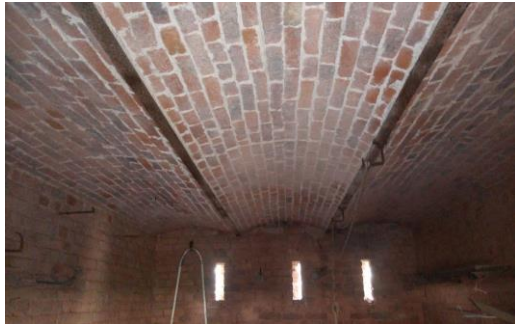
Gewelfde vloer boven kelder in baksteenmetselwerk.