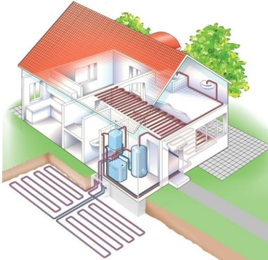
Bodem-waterwarmtepomp met horizontale grondwarmtewisselaar